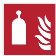
Poste de déclencheur à distance F014