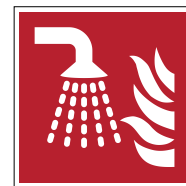
Système d'extinction d'in- cendie par brouillard d'eau F011