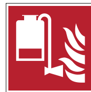
Unité portable d'application de mousse F010