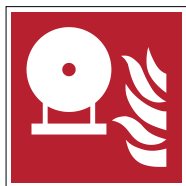
Extincteur d'incendie fixe F013