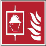
Firefighters' lift F017