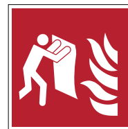
Couverture anti-feu F016