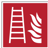
Echelle d'incendie F003