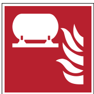
Installation fixe d'extinction d'incendie F012