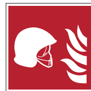
Ensemble d'équipements de lutte contre l'incendie F004B*