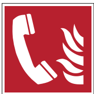
Téléphone à utiliser en cas d'incendie F006