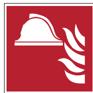
Ensemble d'équipements de lutte contre l'incendie F004