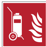
Extincteur d'incendie sur roues F009