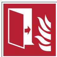
Porte coupe-feu F007