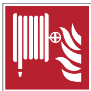
Robinet d'incendie armé F002