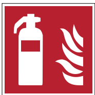
Extincteur d'incendie F001