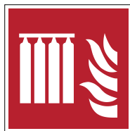
Système fixe d'extinc- teurs d'incendie en série F008