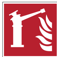
Moniteur d'incendie F015