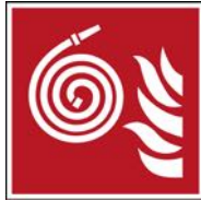
Tuyau d'incendie non raccordé F019