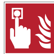
Point d'alarme incendie F005