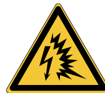
Danger Arc électrique W042