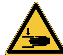
Ecrasement des mains W024