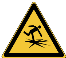
Danger Glace mince W043