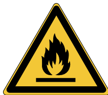
Matières inflammables W021