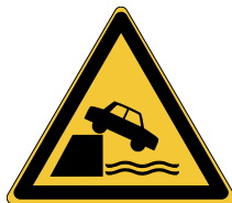
Danger Berges non protégées W051