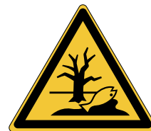
Danger ; Substance ou mélange présentant un risque pour l'environnement W072