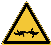
Fil barbelé W033