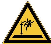
Danger Eaux profondes W047