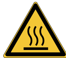
Surface chaude W017