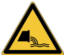
Danger Évacuation des eaux usées W055