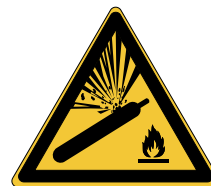
Bouteille pressurisée W029