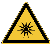
Rayonnement optique W027