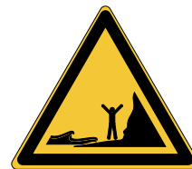
Danger Marées montantes W060