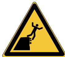
Danger Bord de la falaise instable W052