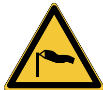
Danger Vents forts W064