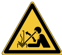
Déplacement rapide de la pièce à mettre en forme dans une presse plieuse W032