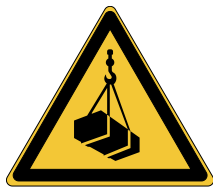
Charges suspendues W015