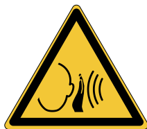
Bruit fort soudain W038