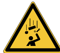
Chute d'objets W035