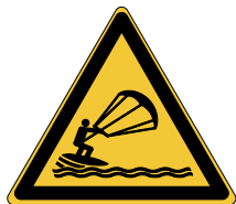
Danger Pratique du kitesurf W062