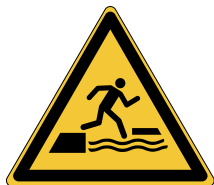
Danger ; Risque de chute dans l'eau lors de la montée ou de la descente sur une surface flottante W068