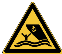
Danger Zone de navigation W058