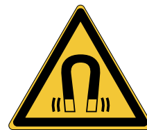
Champ magnétique W006