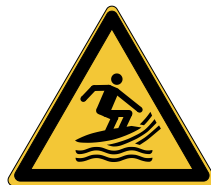
Danger Zone de pratique du surf W046