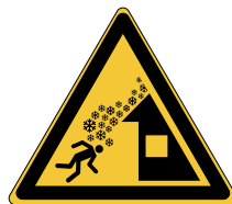
Chute de neige du toit W040