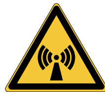
Radiations non ionisantes W005