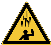
Chute de glace W039