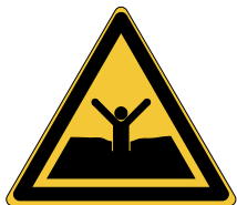
Danger Sables mouvants ou vase/vase profonde ou limon W061