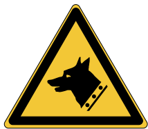
Chien de garde W013