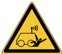
Machine commandée à distance par l'opérateur W037