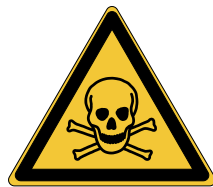
Matières toxiques W016