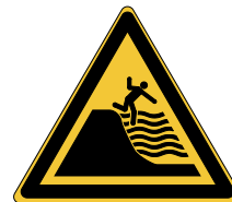
Danger Plage à forte déclivité W066