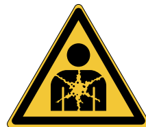
Danger ; Substance ou mélange présentant un risque pour la santé W071