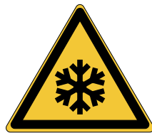
Basses températures, conditions de gel W010