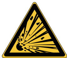
Matières explosives W002