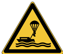
Danger Parachutes ascensionnels W063