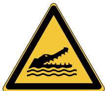
Danger Crocodiles, alligators ou caimans W067