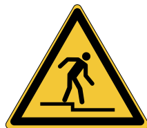
Danger ; Marche descendante W070