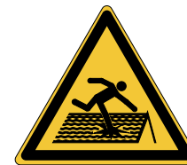
Toiture fragile W036