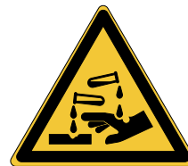
Substances corrosives W023