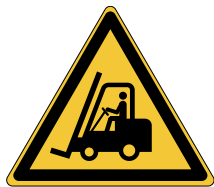
Chariots élévateurs et autres véhicules industriels W014