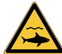
Danger Requins W054