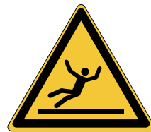
Surface glissante W011