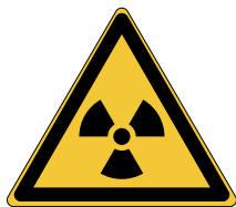
Matières radioactives ou radiations ionisantes W003