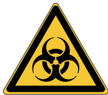
Risque biologique W009