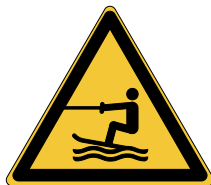
Danger Zone d'activités nautiques tractées W045