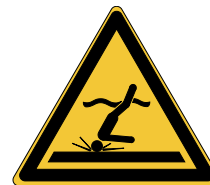
Danger Eau peu profonde W048