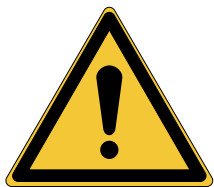
Panneau général W001*