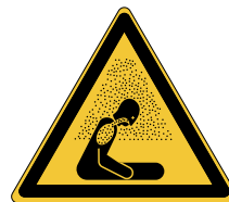
Atmosphère asphyxiante W041