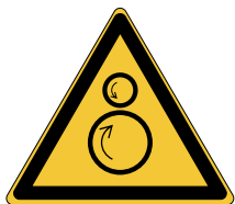
Rouleaux contrarotatifs W025