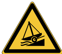
Danger Rampe de mise à l'eau W044