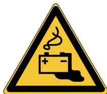
Charge de la batterie en cours W026