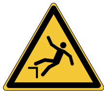
Chute avec dénivellation W008