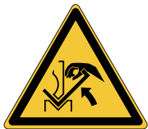
Ecrasement de la main dans l'outil d'une presse plieuse et la matériau W031