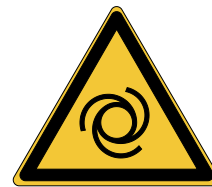
Démarrage automatique W018

* Doit être accompagné d'un message d'avertissement