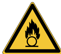
Substances comburantes W028