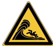
Danger Vagues déferlantes ou hautes W065