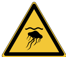
Danger ; Méduses W069