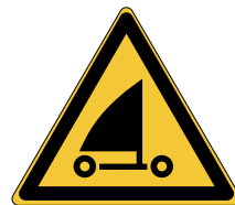
Danger Pratique de la voile W059