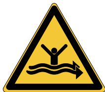
Danger Courants forts W057