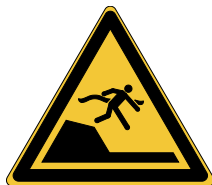
Danger Changement brutal de profondeur du bassin W050