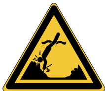
Danger Objets immergés W049