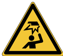
Obstacle en hauteur W020