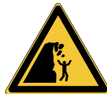
Danger Falaise instable W053