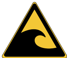
Danger Zone à risque de tsunami W056