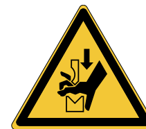
Ecrasement de la main dans l'outil d'une presse plieuse W030