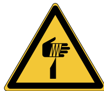
Élément pointu W022